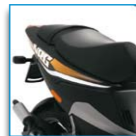
Vano sottosella capace di ospitare un casco integrale