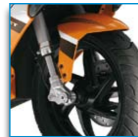
Forcella upside-down per una straordinaria tenuta di strada