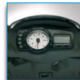
Strumentazione analogica e digitale