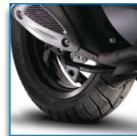
Ruota posteriore maggiorata per la massima stabilità di guida