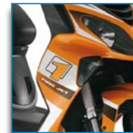
Nuovi grafiche iper sportive