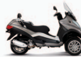
MP3 TOURING LT