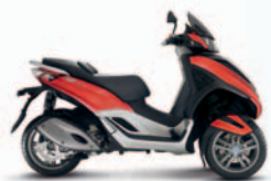
MP3 YOURBAN LT