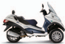
MP3 HYBRID LT