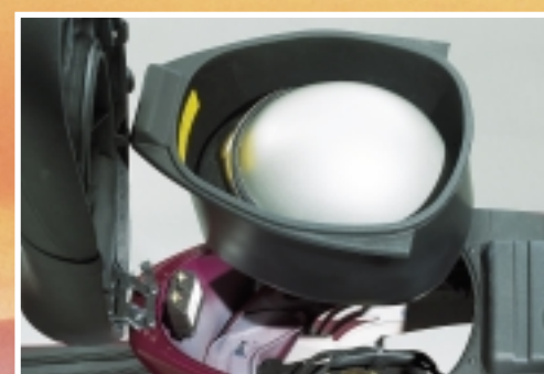
Vano portacasco asportabile per un facile accesso al motore