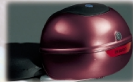
Bauetto posteriore nel colore del veicolo