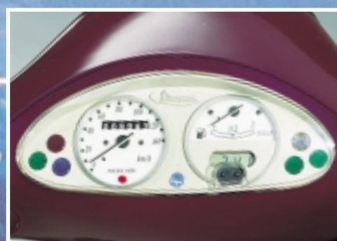
Strumentazione chiara e completa, di elegante design, comprende anche un led che segnala l'attivazione del sistema antifurto. L'immobilizer consente l'accensione del motore solo se identifica il codice della chiave.