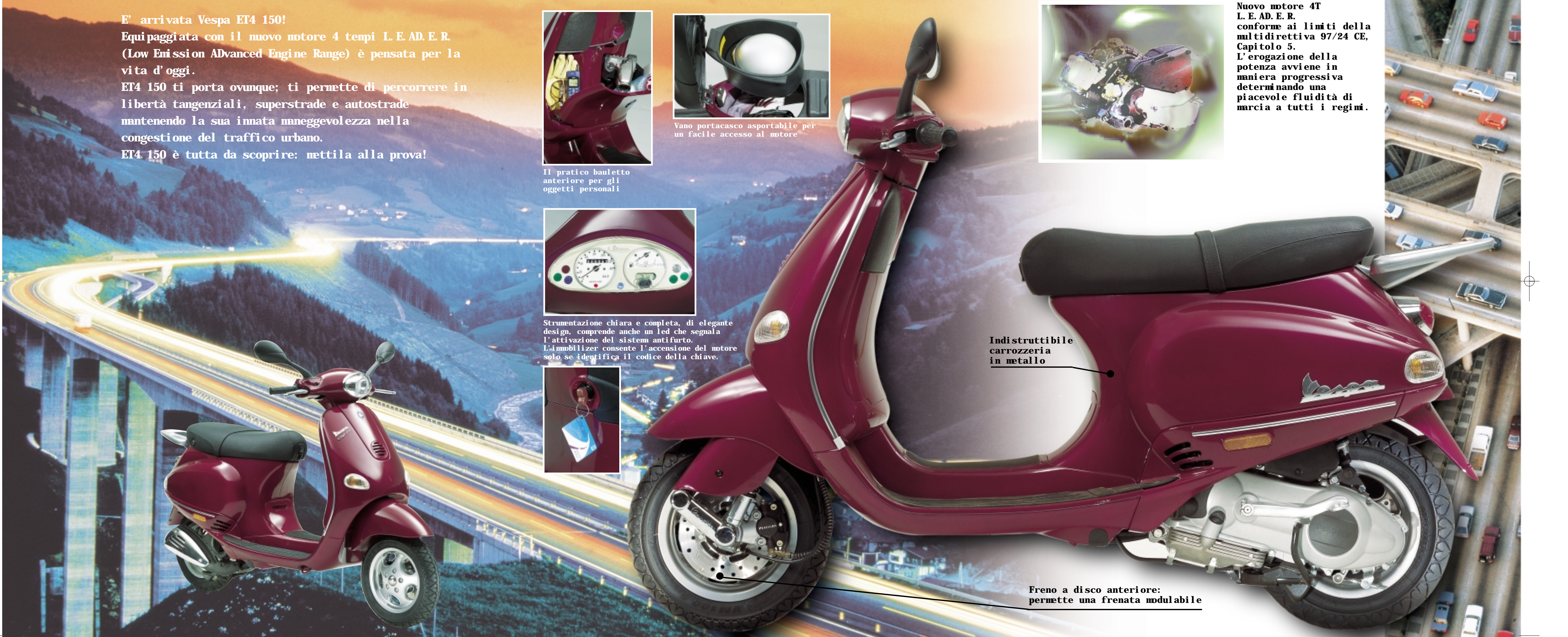
Freno a disco anteriore: permette una frenata modulabile