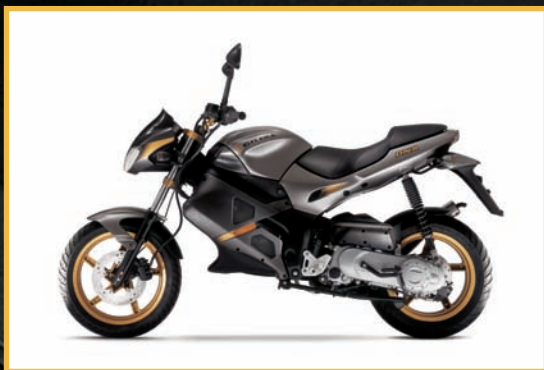
CENERE OPACO/GRIGIO STONE