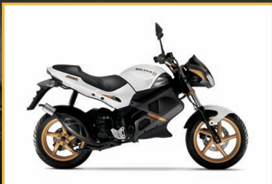
CENERE OPACO/BIANCO DIAMANTE